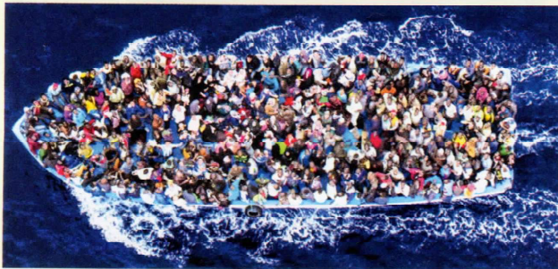
Las pateras son botes precarios que atestados de inmigrantes cruzan los mares para llegar a Europa

Según datos de la Oficina de las Naciones Unidas contra la Droga y el Delito (UNODC), se estima que cada año 55.000 migrantes son objeto de tráfico "ilícito" de África oriental, septentrional y occidental a Europa y producen un ingreso cercano a los 150 millones de dólares para los que organizan las travesías. Los migrantes realizan largos trayectos por zonas desérticas y mares tempestuosos, que ocasionan decesos en muchos de los casos: entre 1996 y 2011, como mínimo 1691 personas perdieron la vida en viajes por el desierto y, en 2008, se produjeron 1000 muertes en los viajes en embarcaciones precarias (pateras) y barcos por el mar Mediterráneo o el Océano Atlántico.