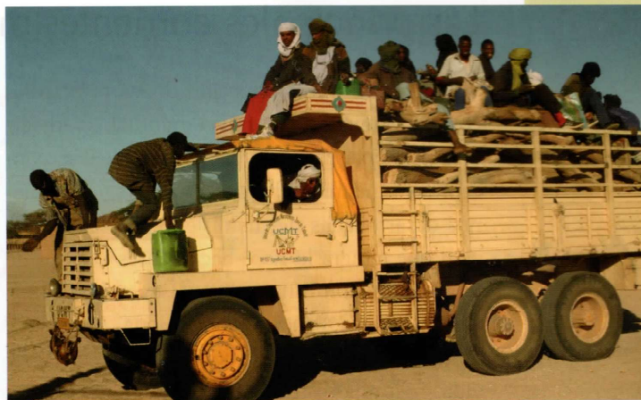
Vista de un camión con emigrantes nigerianos que deben realizar una larga travesía hasta las costas para cruzar el mar Mediterráneo a Europa.

El aumento de las inmigraciones en Europa Occidental en las últimas décadas ha suscitado algunos brotes de xenofobia , o sea de odio, aversión u hostilidad para con los extranjeros. Una explicación sobre la existencia de esta fobia, es que los europeos ven a los extranjeros como competidores desleales en procura de tra-