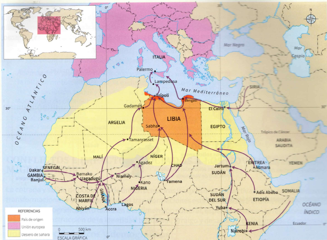
Rutas migratorias a través de Libia