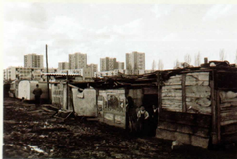
Bidonville argelino de Nanterre, Francia (1966). Los bidonvilles son asentamientos precarios similares a las villas en Argentina o las favelas en Brasil

Dentro de estos guetos que acabamos de mencionar, los edificios suelen ser antiguos en viviendas pequeñas, en las que uno de los principales problemas es el hacinamiento, es decir, que en cada habitación de la vivienda viven y duermen tres o más personas. Además, los franceses tienen prioridad al momento de acceder a la vivienda social: solo un 6,5% de las mismas son destinadas a