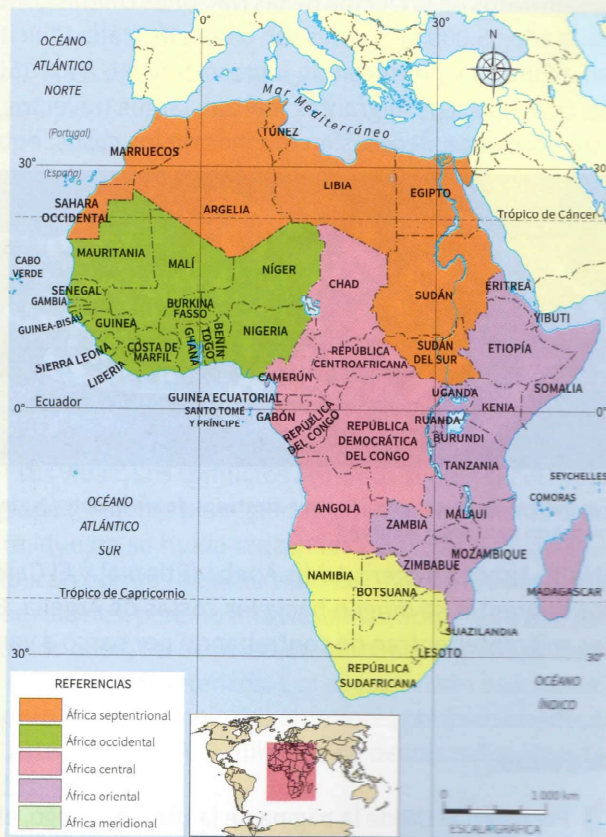
Esta regionalización del continente africano nos permite visualizar países y regiones o zonas según su localización relativa: África septentrional, África occidental, África central, África oriental y África meridional

África es el tercer continente más grande del mundo, con una superficie total de 30.272.922 km 2 y una población total estimada de 1320 millones de habitantes. Para 2017, había más de 36 millones de inmigrantes africanos en el mundo, colocando al continente entre las zonas del mundo que menos expulsa población. Los africanos que emigran lo hacen principalmente hacia otros países dentro del continente africano, y en menor proporción lo hacen hacia Europa. Podemos identificar algunas características de las migraciones intrafricanas: suelen ser con destino rural-urbano, aunque también existen desplazamientos rurales hacia zonas en las que pueden acceder a tierras o a desarrollar trabajos temporarios. Otro rasgo es que los flujos migratorios se concentran desde los países del interior hacia los costeros que, en general, tienen un nivel de desarrollo mayor. Además, la inmigración es casi en su totalidad masculina y con un promedio de edad de 30 años.