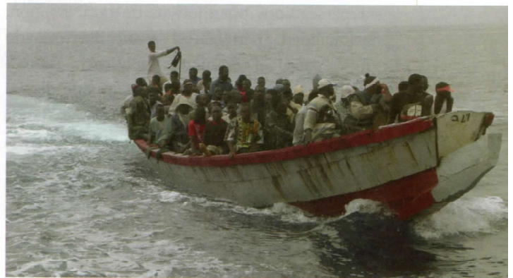
Vista de una patera en el mar Mediterráneo con emigrantes africanos con destino a Europa.

Específicamente en materia migratoria el compromiso activo de España es abordar este fenómeno incluyendo la organización conjunta de la migración regular, la lucha contra la inmigración ilegal y las mafias que trafican con seres humanos y el fortalecimiento de políticas públicas que minimicen las consecuencias negativas de la migración sobre el desarrollo.